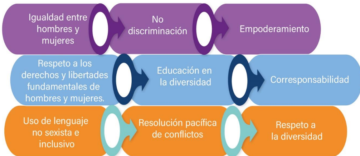
GRÁFICO 5: PRINCIPIOS PARA LA EDUCACIÓN EN IGUALDAD

Es necesario garantizar los siguientes principios para cumplir la educación en igualdad.