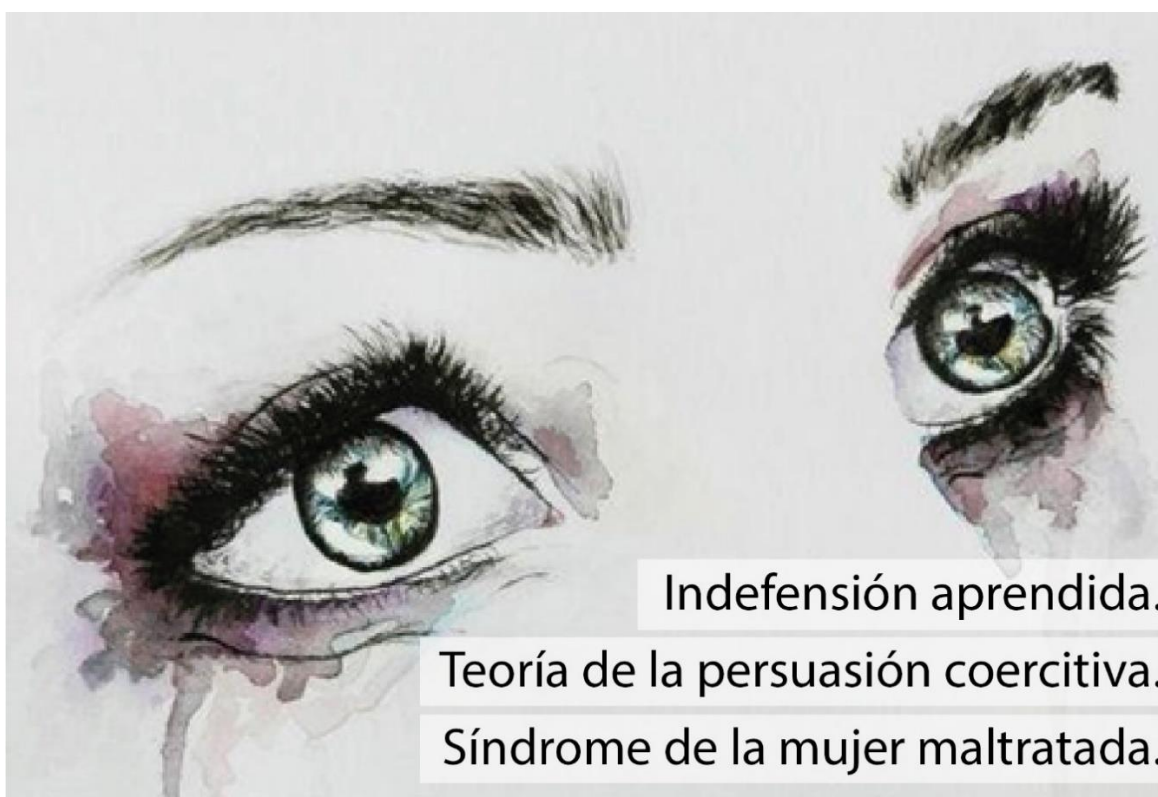
GRÁFICO 1: ESTADOS PSICOLÓGICOS EN LA VIOLENCIA BASADA EN GÉNERO.