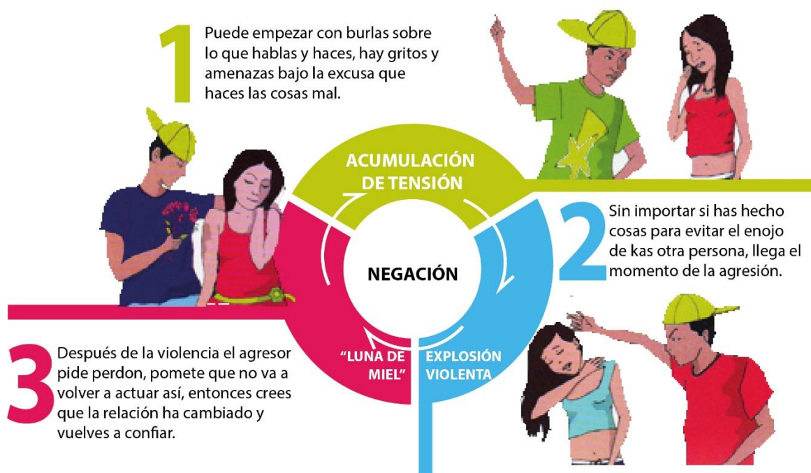
GRÁFICO 2: CICLO DE LA VIOLENCIA, SEGÚN LENORE WALKER