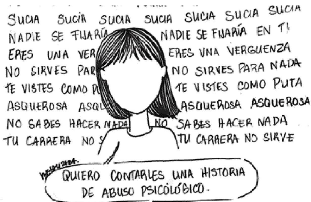
GRÁFICO 3: VIOLENCIA PSICOLÓGICA

Si te sientes limitada y criticada por tu forma de vestir, acosada por como actúas o te relacionas con otras personas, frecuentemente te celan o culpabilizan de provocar sentimentalmente a alguien, podrías estar siendo víctima de violencia psicológica y/o emocional.